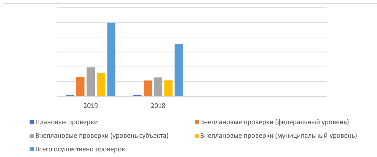
Рис.1 – Проверки, проводимые ФАС России в 2018/2019 г. [6]