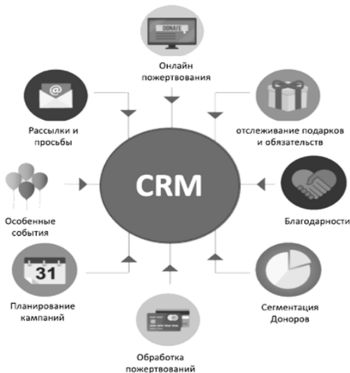
Рисунок 2 — функции CRM — системы в некоммерческой организации (источник заимствования: CRM для НКО на базе Битрикс24 [Электронный ресурс]. URL: https://crm.amiveo.com/fund/#b2817 )

DRM-system), т.е. аналога повсеместно используемой системы управления взаимоотношениями с клиентами (CRM – системы). На рисунке 2 представлены необходимые функции для системы[10].