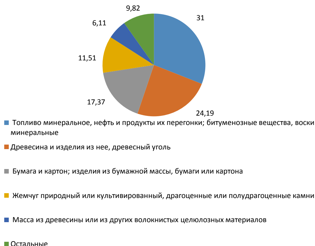
Рис. 1 - Товарная структура экспорта Архангельской области по стоимости в 2020 году, в %

На рисунках 1 и 2 представлена товарная структура экспорта Архангельской области за 2020 год по стоимости и по массе.