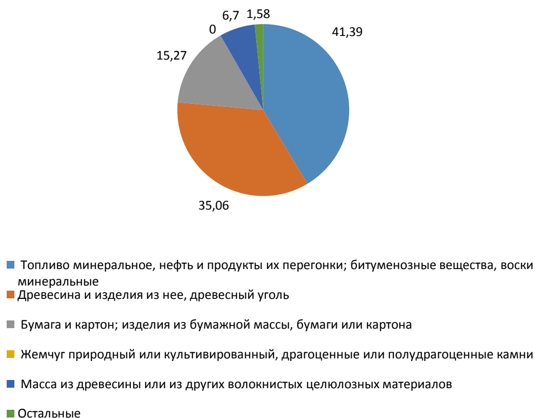
Рис. 2 - Товарная структура экспорта Архангельской области по массе в 2020 году, в %

битуменозные вещества, воски минеральные (доля по стоимости – 31 %, доля по массе груза - 41,39 %). На втором месте находится древесина и изделия из нее, древесный уголь (доля по стоимости – 24,19 %, доля по массе груза – 35,06 %). Третье место в структуре экспорта занимает бумага и картон; изделия из бумажной массы, бумаги или картона (доля по стоимости – 17,37 %, доля по массе груза – 15,27 %). Следует отметить, что экспорт драгоценных или полудрагоценных камней занимает серьезные позиции в структуре экспорта Архангельской области (11,51 %) [4].