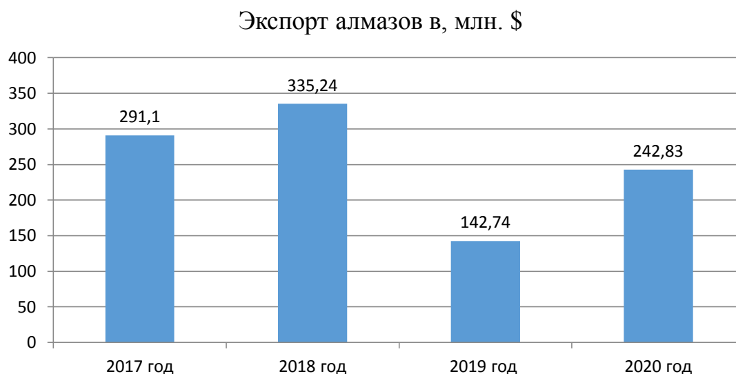
Рис. 5 - Динамика экспорта продукции алмазодобывающей отрасли Архангельской области в 2017-2020 гг., в млн. $