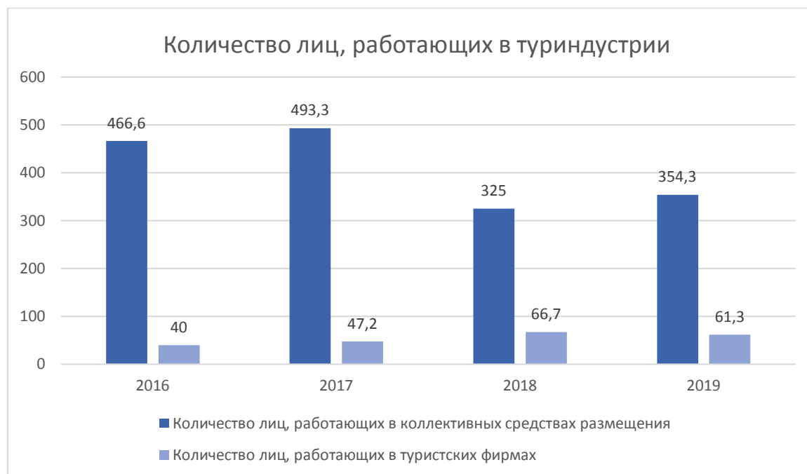
Рисунок 1 – Изменения количества лиц, работающих в коллективных средствах размещения и в туристских фирмах в России, тыс. чел (Составлен автором)

Из-за пандемии коронавируса как в мире, так и в России, туристская отрасль понесла большие потери. Большинству предприятий туризма и гостеприимства пришлось закрыться, многие сотрудники были уволены или отправлены в неоплачиваемые отпуска. Например, туроператор «Русь-тур», который просуществовал на туристском рынке достаточно долгое время, прекратил свою деятельность из-за эпидемиологического кризиса. Он был исключен из реестра туроператоров в декабре 2020 года [10].