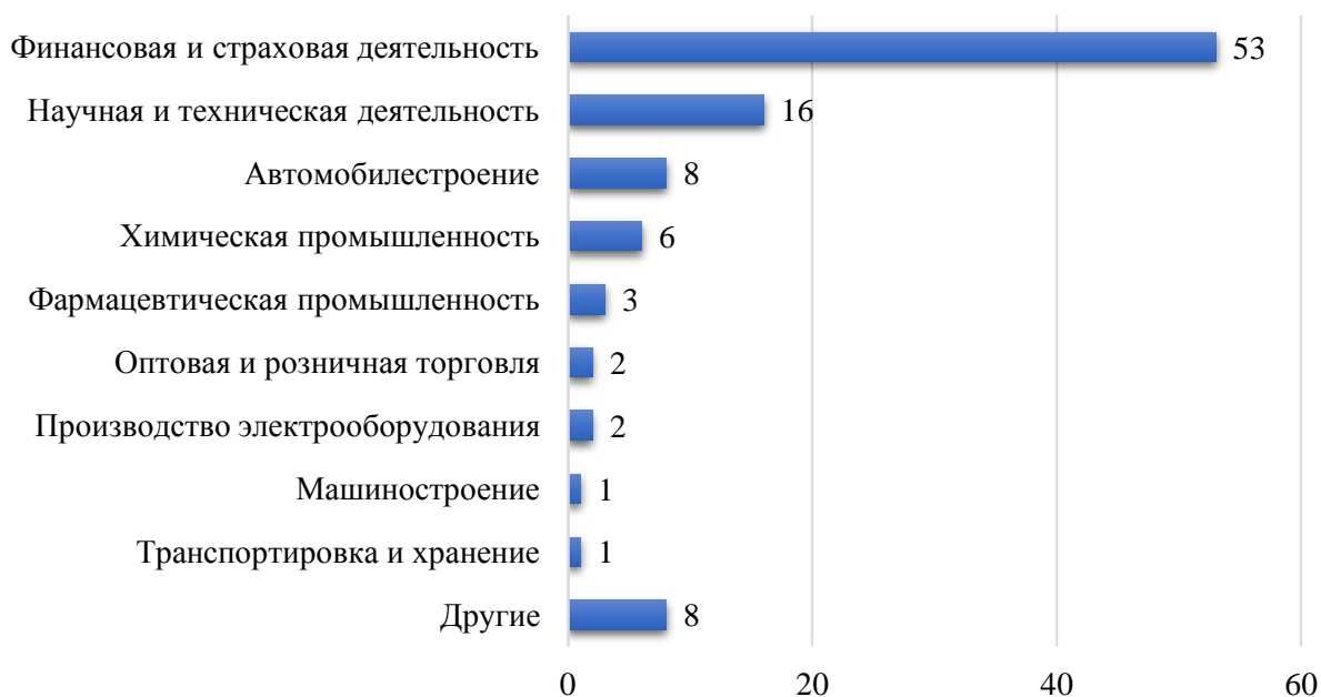
Рис. 3 – Структура накопленных ПИИ ФРГ за рубежом по отраслям, 2020 г.

На основе данных таблицы 3 проиллюстрируем главные отрасли прямых немецких инвестиций в экономики зарубежных стран к 2020 году (рисунок 3).