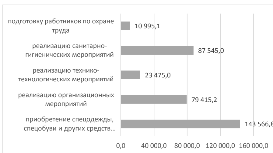
Рисунок 2 – Израсходовано на мероприятия по охране труда в г. Севастополь за 2021 год, тыс.руб., (составлено авторами)

На сегодняшний день ситуация значительно улучшилась благодаря оптимизации основных нормативно-правовых актов в сфере охраны труда [2; 3]. На рисунке 2 показано, сколько денежных средств было израсходовано на мероприятия по охране труда в 2021 году.