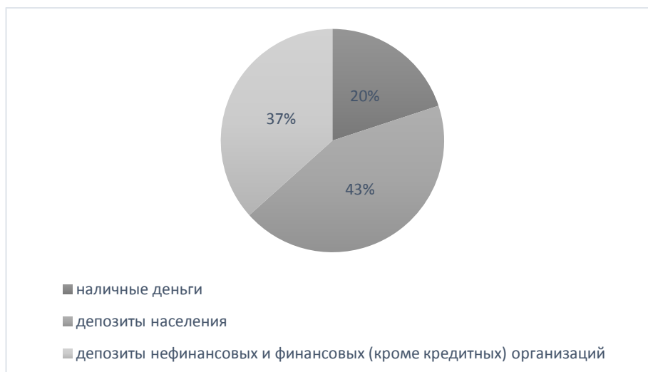
Рис. 1 - Структура денежной массы M_2 на 1 февраля 2022 г. [4].

Структура денежной массы M_2 на 1 февраля 2022 г.: