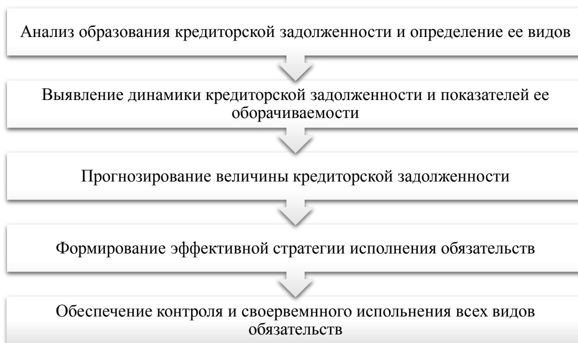
Рис. 1 – Алгоритмизация системы управления кредиторской задолженностью

Стоит отметить, что система эффективного управления кредиторской задолженностью носит многофакторный характер, который во многом зависит от отрасли, в которой ведется деятельность, и совокупного объема, однако базовый алгоритм является универсальным и представлен на Рисунке 1.