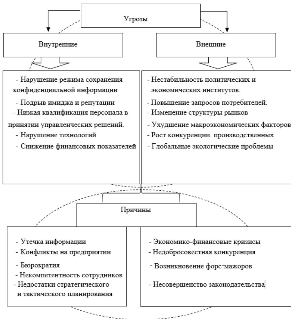
Рис. 2. Угрозы и причины экономической безопасности организации [4]

воздействия эндогенных и экзогенных угроз, которые дестабилизируют экономику организации факторов. Суть обеспечения экономической безопасности - результат достижения установленных целей [5].