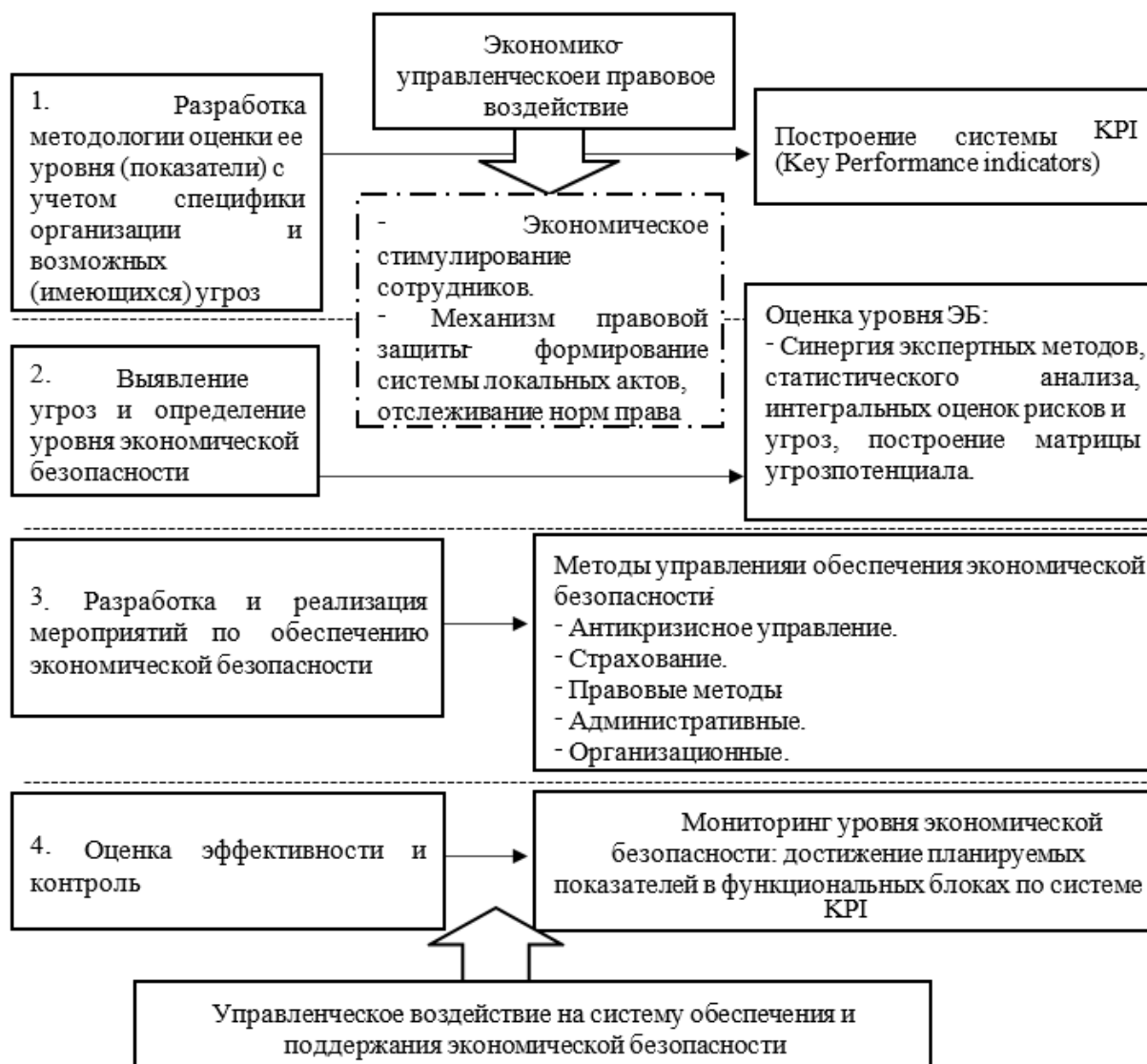
Рис. 3 - Механизм экономико-правового обеспечения экономической безопасности [2, 3]

стабильность бизнес-процессов, достижение ключевых видов деятельности, совершенствующие и развитие [6].