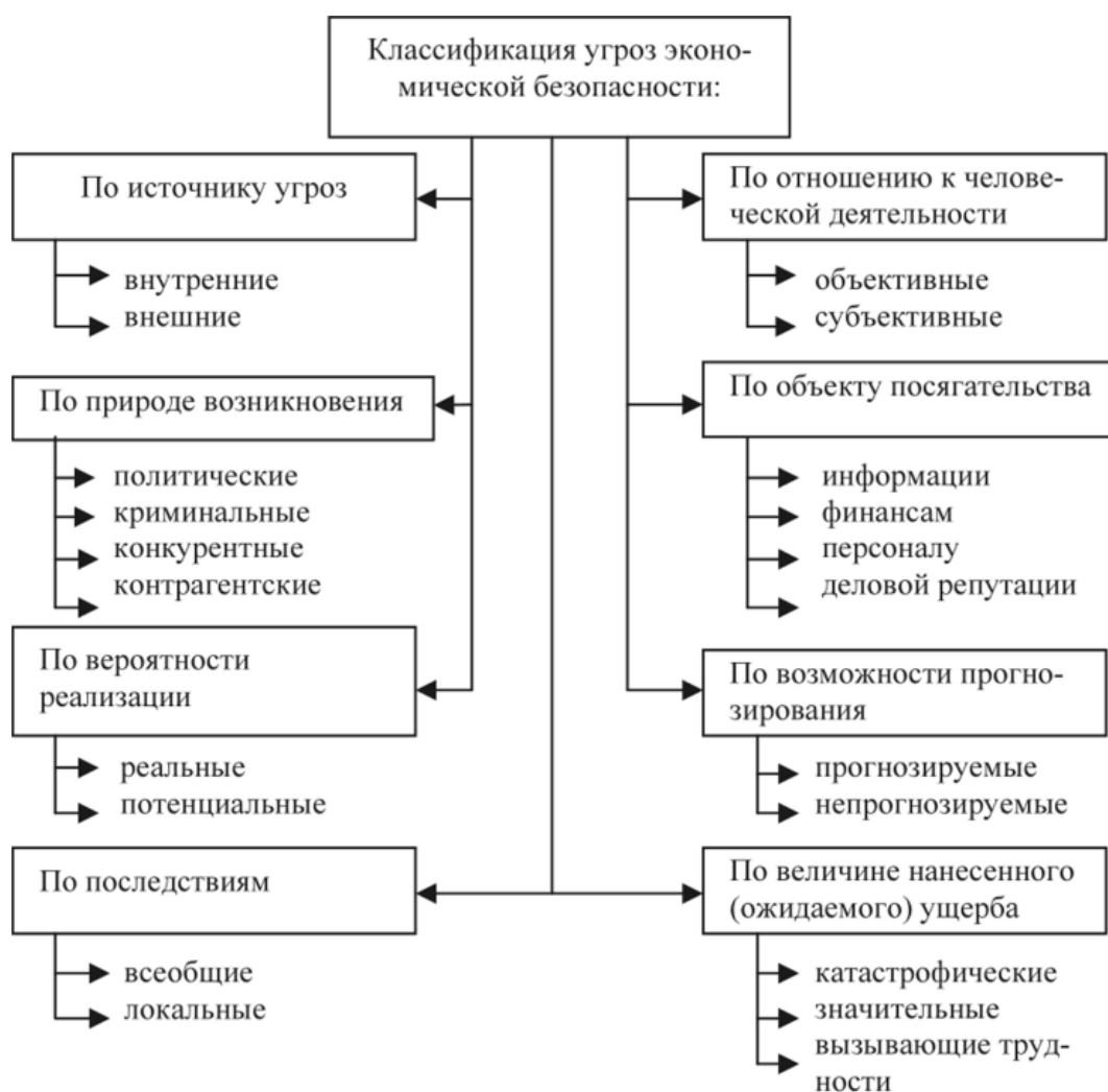
Рисунок 1 – Классификация угроз экономической безопасности [15]