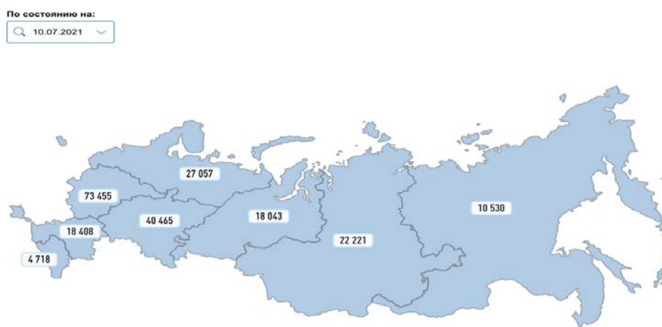
Рис. 2. Число субъектов МП в регионах России в июле 2021 года.

Для оценки влияния пандемии на малый и средний бизнес, сопоставили данные Единого реестра МСП, согласно которым число субъектов сократилось с 10. 07. 2021- 10. 12. 2021 гг. на 1%.