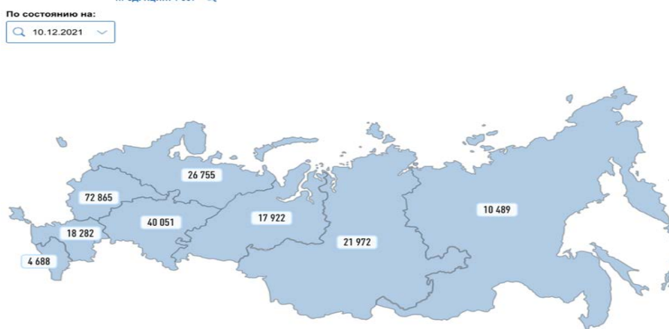
Рис. 3. Число субъектов МП в регионах России в декабре 2021 года.