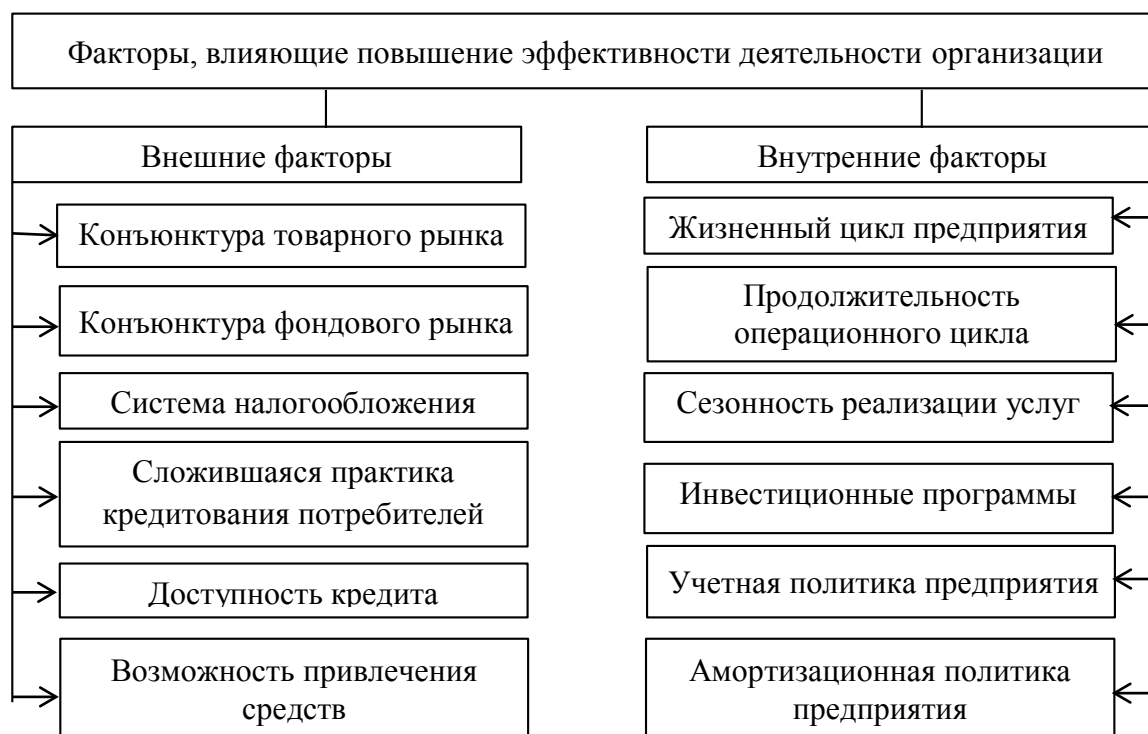
Рисунок 1 - Основные факторы, влияющие на повышение эффективности деятельности организации

Что касается факторов внешней среды, то их делят на факторы прямого и косвенного воздействия (рисунок 2) [4].