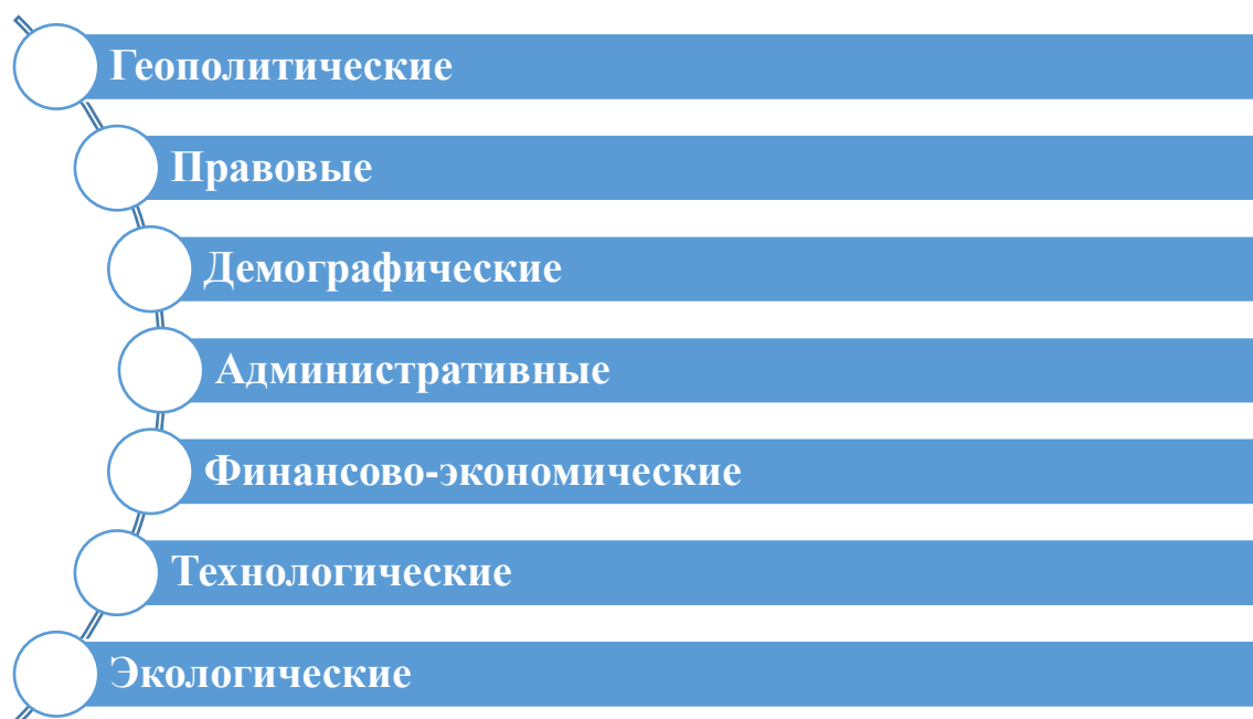
Рисунок 1 – Возможные риски муниципального образования городского округа «Усинск» [1]

Далее обозначим основные риски муниципального образования городского округа «Усинск» на период до 2035 года согласно стратегии социально-экономического развития (рисунок 1).