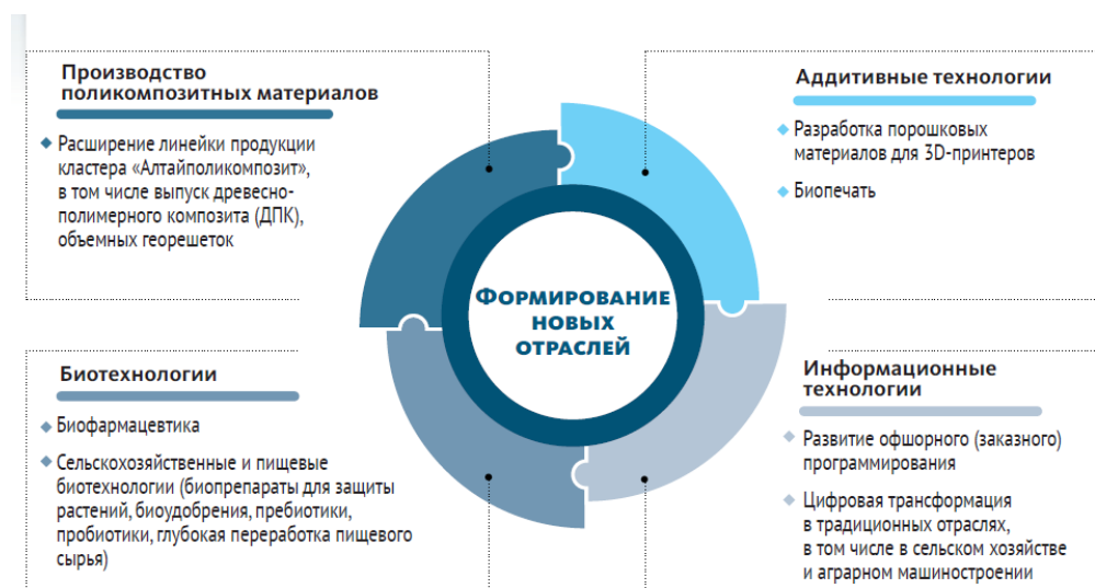
Рисунок 4-Структура развития новых отраслей Алтайского края[2,4]

Одним из перспективных направлений развития АПК региона является «точное» земледелие; рынка Foodnet; формирование новых отраслей в области биотехнологий; расширение кластерных технологий в межотраслевом взаимодействии ( рис.4)