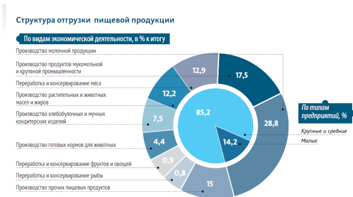
Рисунок 2-Структура производства продукции пищевой отрасли региона [ 2,3]

Оценка видов экономической деятельности позволяет выделить производство молочной продукции (более 28%); мукомольной и крупяной (более 17%); переработка мяса и производство растительных и животных жиров занимают более 12%; остальные подотрасли пищевого производства не занимают существенный удельный вес в структуре производства пищевой промышленности (рис.2).