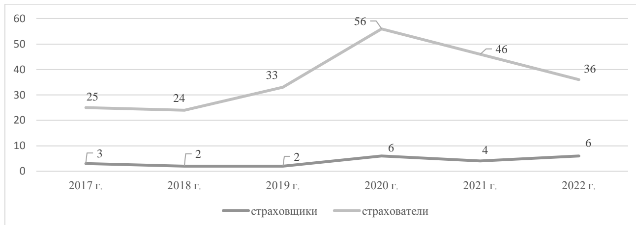
Рис. 1 – Динамика участников страховых отношений в области растениеводства, подлежащих субсидированию в Алтайском крае [авторская разработка]

В Алтайском крае рамках решения задачи по снижению потерь сельхозтоваропроизводителей в области растениеводства в крае осуществлялась поддержка страхования сельскохозяйственных культур. На рынке страховых услуг края с государственной поддержкой в 2022 году работали 6 страховых организаций, которые осуществляли страхование сельскохозяйственных культур, имея лицензию на осуществление страховой деятельности и являясь членами объединения страховщиков (АО СК «РСХБ-Страхование», ООО «СК «Согласие», ООО СК «Сбербанк страхование», ООО «Абсолют-страхование», САО «ВСК», СПАО «Ингосстрах»). Следует отметить, что в сравнении с 2017 годом число таких организаций выросло в два раза (рис. 1).