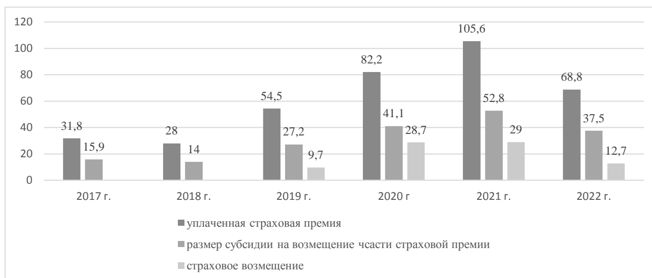
Рис. 3 – Динамика финансовых отношений сторон договоров страхования в области растениеводства, подлежащих субсидированию в Алтайском крае, млн. руб. [авторская разработка]

страхования с государственной поддержкой, выплаченные государством субсидии на возмещение страховых премий ежегодно составляют 50 % от общей суммы страховых взносов, уплаченных страхователями-аграриями. Благодаря тому, что в 2017-2018 годах у страхователей края не были зафиксированы страховые случаи, все уплаченные ими взносы остались в качестве доходов у страховщиков. Погодные условия 2020-2021 годов обернулись для аграриев края потерями урожая. В эти годы зафиксированы максимальные суммы страховых возмещений на уровне 28,7-29 млн. руб., выплаченных пострадавшим хозяйствам. Среднее страховое возмещение на одно пострадавшее хозяйство в 2022 г. составило около 353 тыс. руб.