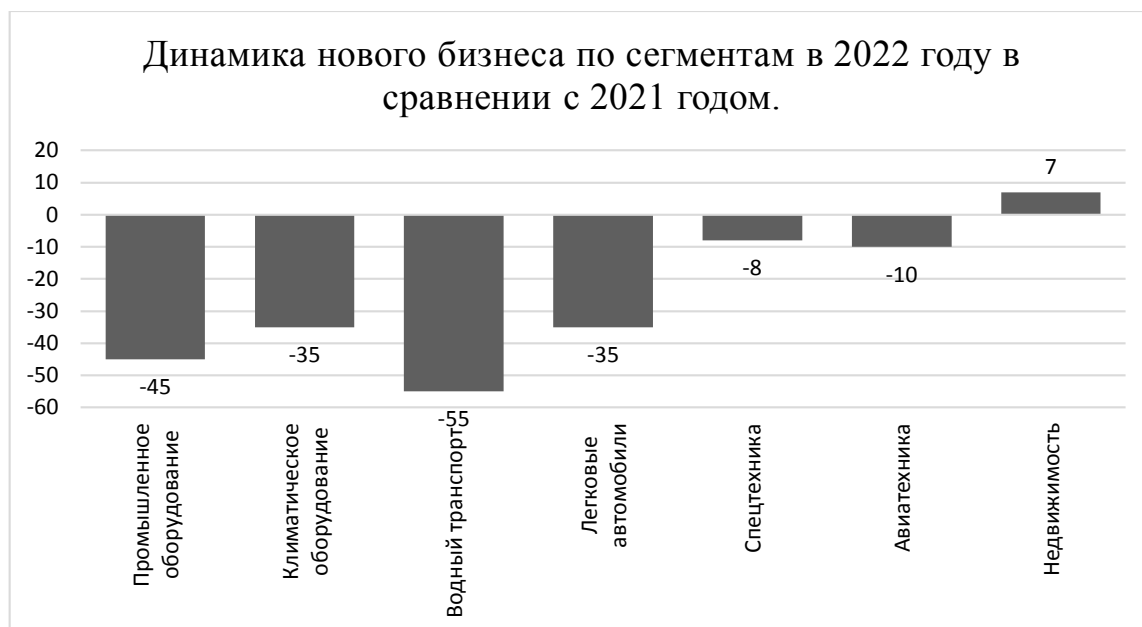
Рисунок 2. Динамика нового бизнеса по сегментам в 2022 году в сравнении с 2021 годом.

В условиях санкций лизинговым компаниям пришлось искать новых поставщиков в странах Азии и СНГ и перестраивать логистику.