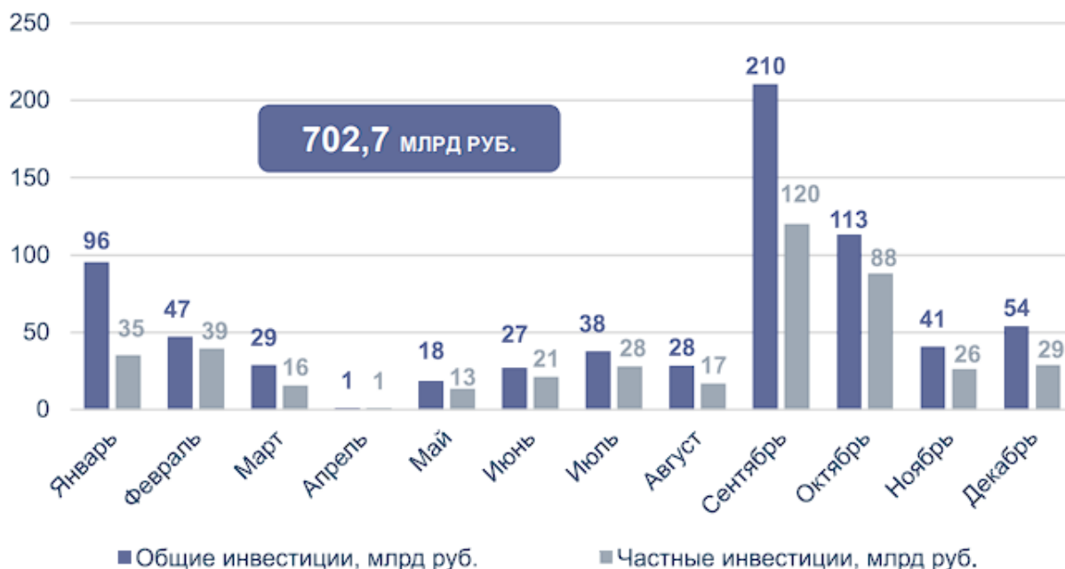
Рис. 5 - Объем общих и частных инвестиций в ГЧП-проекты, прошедшие коммерческое закрытие в 2022 году [4]

В 2022 году коммерческое закрытие прошли 316 проектов в форме КС и СГЧП/СМЧП (рисунок 4) с общим объемом инвестиций 702,7 млрд руб., из которых 433,1 млрд руб. – частные средства (рисунок 5). Это рекордные показатели за последние три года.