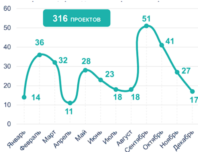
Рис. 4 - Количество проектов, прошедших коммерческое закрытие в 2022 году, в форме КС и СГЧП/СМЧП [2]

Также несмотря на то, что «соглашение о ГЧП/МЧП» по количеству проектов составляет лишь 2,5% от общего объема, инвестиции в данную форму реализации ГЧП-проектов являются весьма существенными. Разумеется, львиная доля инвестиций направлена на реализацию ГЧП-проектов в форме концессионного соглашения.