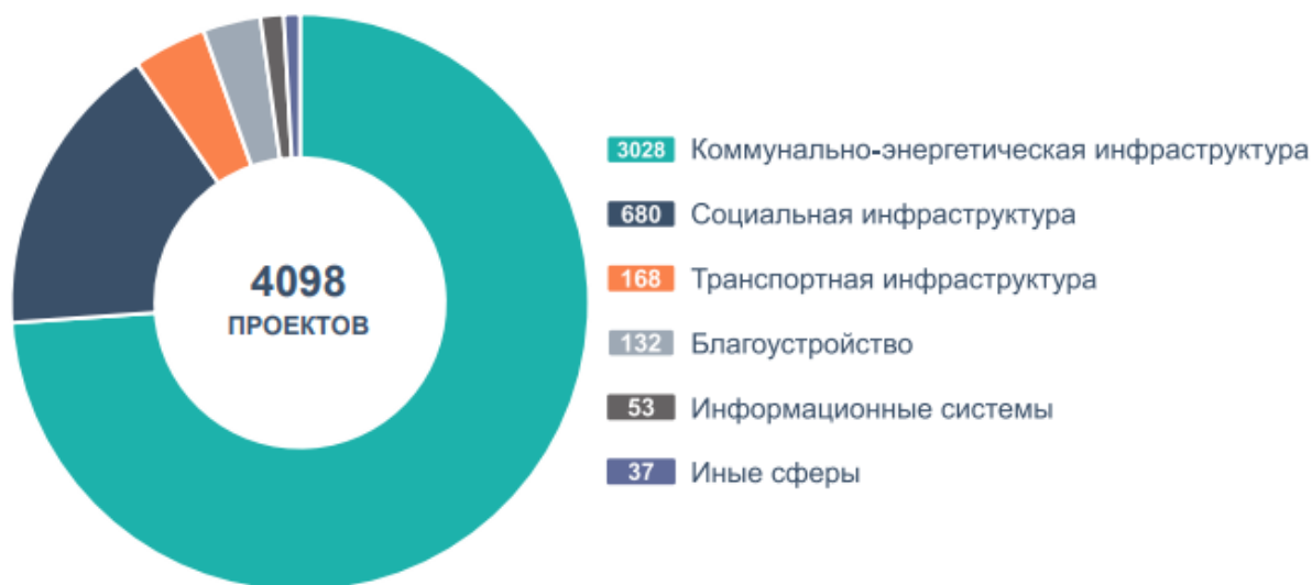
Рис. 1 – Отраслевая структура рынка ГЧП-проектов в России (2022г.) [2]

В совокупном объеме за 2022 год насчитывается общих инвестиций – 6 трлн руб., из которых 4,3 трлн руб. составляют средства частных инвесторов.