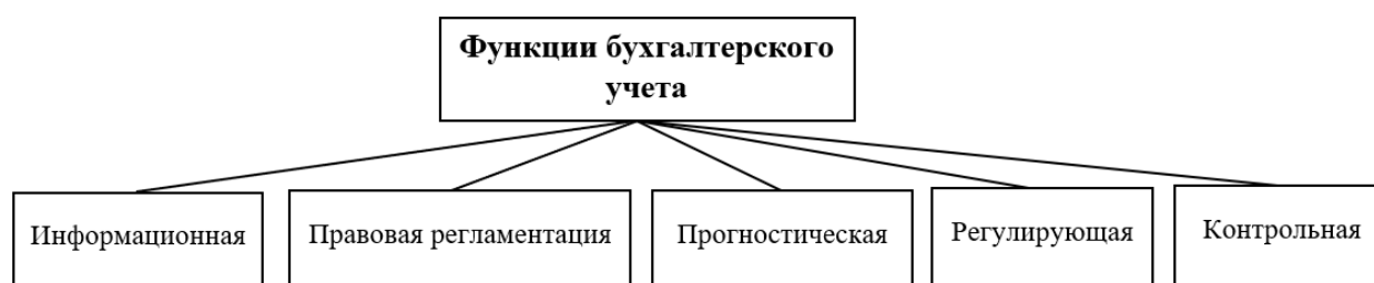
Рис.1 – Функции бухгалтерского учета [3, с.77-78]

Методы бухгалтерского учета позволяют более эффективно осуществлять организационную деятельность, используя следующие функции (рис.1). [3, с.77-78]