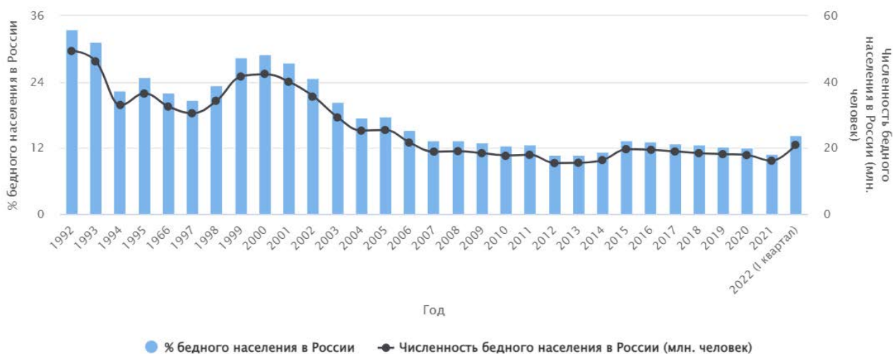
Рисунок 2 – Уровень бедности в России, 1992-2022 гг. [4]

Представленный выше график показывает, что на протяжении 30 лет реализуемые государством программы обеспечивали положительный тренд по снижению уровня бедного населения в России. Так в начале 1992 года уровень бедности достигал 35%. По данным на начало 2022 года уровень бедности был снижен до 13%, то есть 22% было выведено из состояния бедности на уровень среднего класса и выше [9].