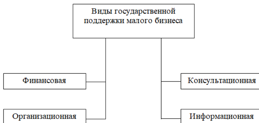
Рис. 2 - Виды государственной поддержки малого бизнеса [2, с.127]

Основные виды государственной поддержки малого бизнеса обозначены на схеме рисунка 2.