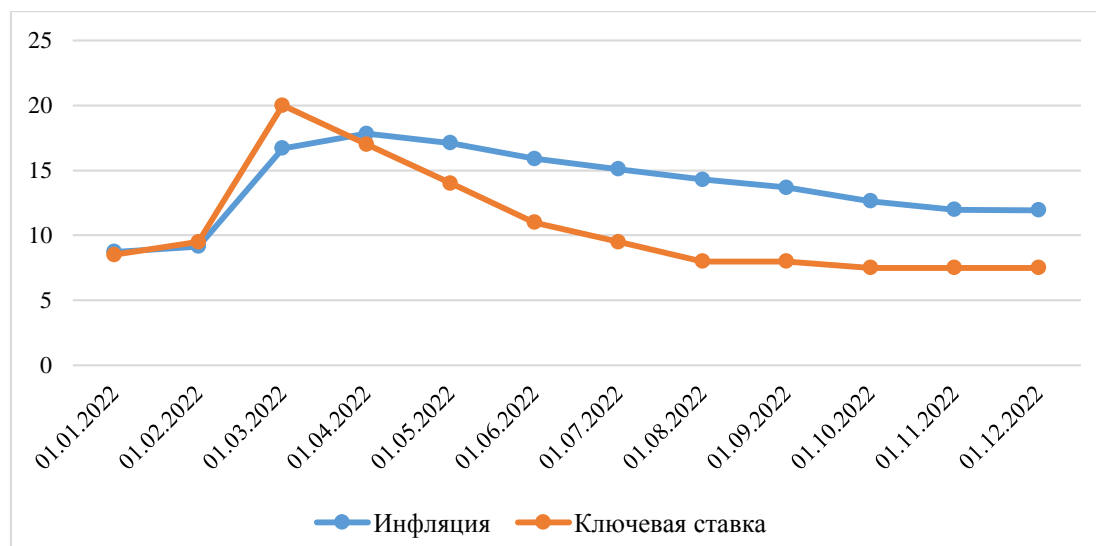
Рис. 1 Динамика инфляции и ключевой ставки в России за 2022г., % [3]

Таким образом, хочется отметить сильное влияние возросшей инфляции на банковский сектор. Крайняя необходимость населения в наличных средствах вызванная паникой, отразилась негативно на всех коммерческих банках. Поднятие процентной ставки в некоторой степени сгладило потрясения банковского сектора, но финансовая стабильность банков в этот период находилась в крайне неустойчивой позиции.