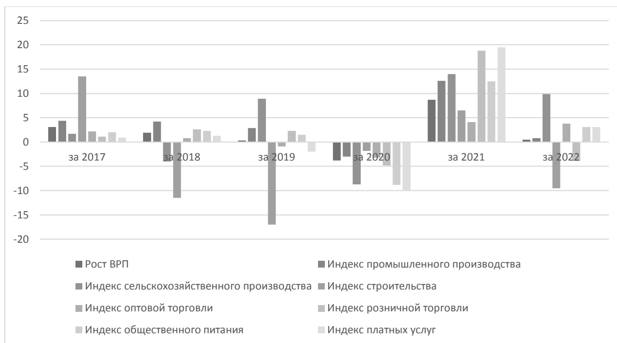
Рис. 1 – Динамика индексов ключевых показателей экономического развития Краснодарского края, % (составлено автором по данным Росстата [8])

На рисунке 1 хорошо видно, что неустойчивая динамика наблюдается в строительстве. Наиболее критичным для экономики края был 2020 г., когда негативное влияние пандемии коронавируса привело к снижению всех показателей.