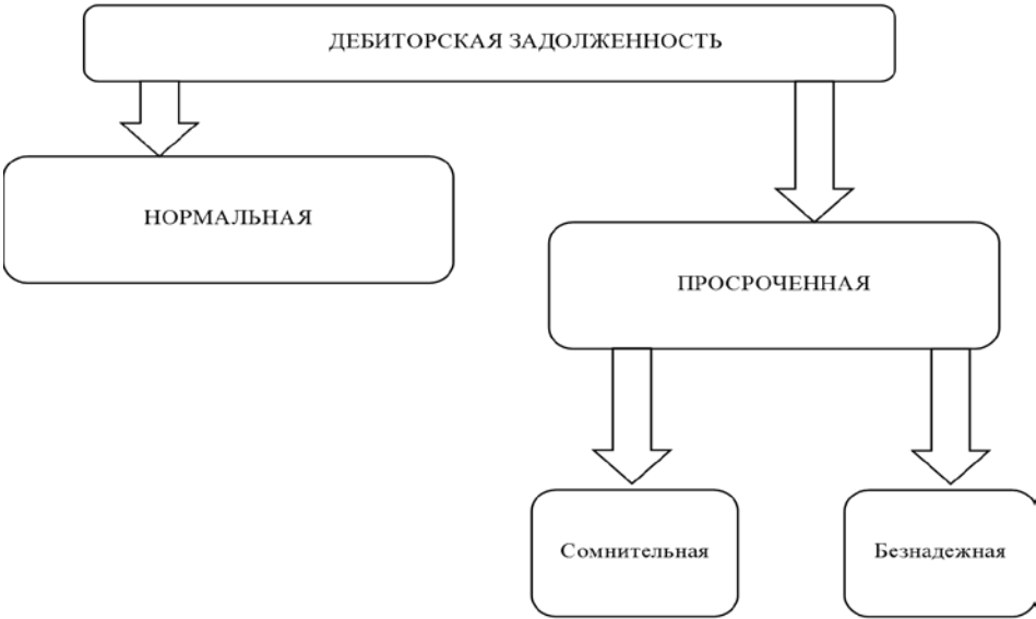
Рис. 2 – Структура дебиторской задолженности. Составлено автором

Структура дебиторской задолженности по срокам исполнения представлена на рис. 2