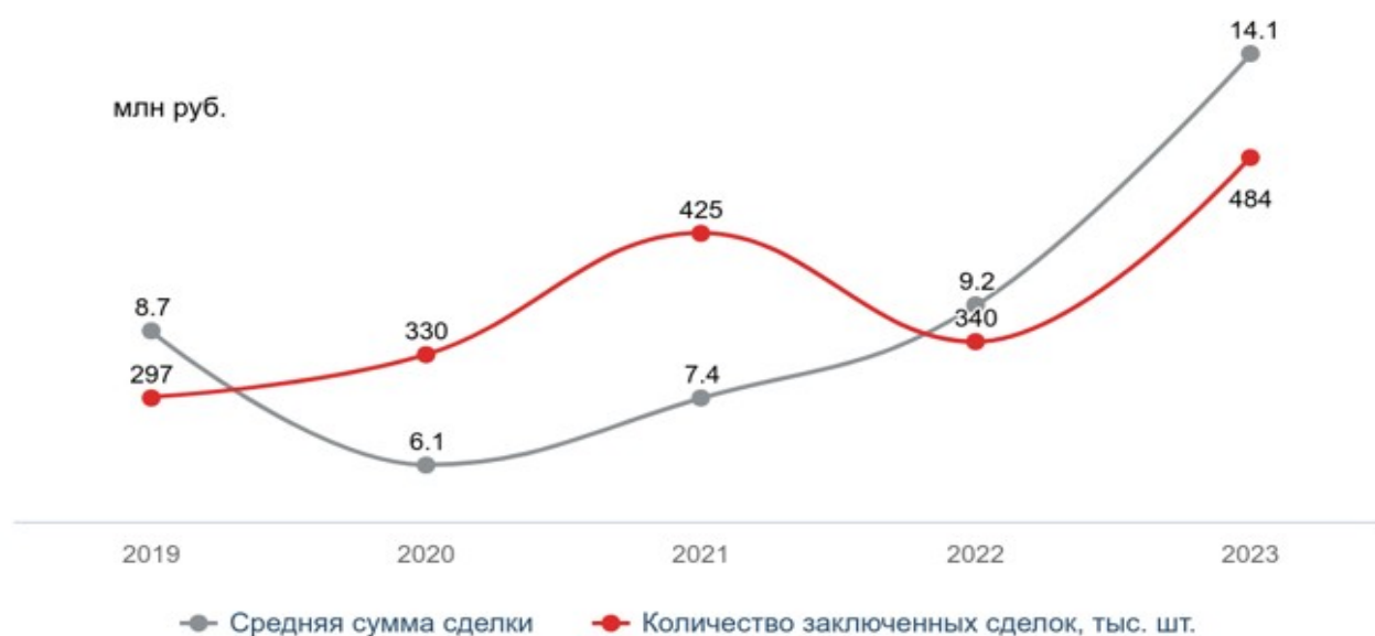
Рисунок 2. Средняя сумма лизинговой сделки (млн.руб.)

Рассмотрим среднюю сумму лизинговой сделки за 2023 год, представленные на рис. 2 [6].