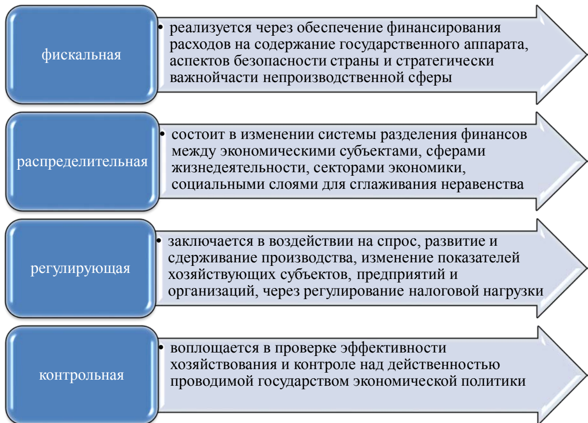
Рис. 3 - Функции экологических налогов. Составлено автором

Таким образом, введение экологических налогов является эффективным инструментом для достижения глобальных целей по регулированию окружающей среды и развитию экологической политики. Несмотря на то, что эффективное внедрение экологических налогов сопряжено с трудностями, устранение препятствий и поиск решений могут повысить их эффективность [5].