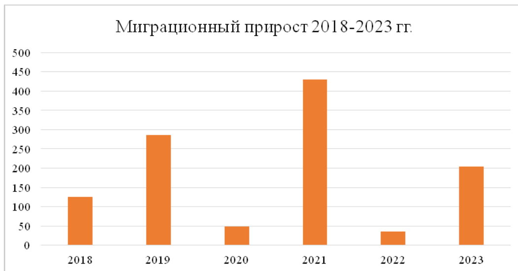
Рисунок 2- Миграционный прирост в период с 2018 по 2023 годы

Российский бизнес успешно приспособился к изменениям, связанным с коронавирусом, а отмена многих ограничений способствовала возвращению мигрантов в Россию [3,9].