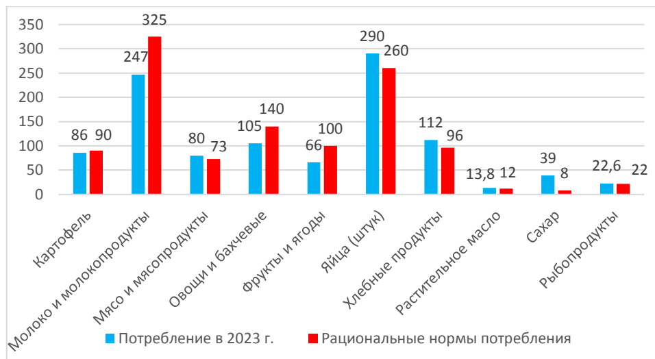
Рисунок 2 - Потребление основных продуктов питания и рациональные нормы их потребления, кг. на чел. в год, 2023 год [2, 11]

Анализ потребления продуктов питания в России выявил значительное расхождение с рекомендуемыми нормами по молочной продукции, фруктам, ягодам и овощам, включая бахчевые культуры. Потребление рыбы находится в пределах допустимых значений, тогда как потребление яиц и сахара превышает рекомендуемые показатели. Серьезное отставание от целевых показателей самообеспеченности наблюдается в тех же сегментах: молочная продукция, овощи и фрукты с ягодами.