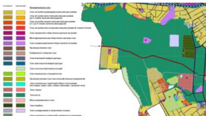
Рис. 2 – Фрагмент генерального плана

Особую тревогу вызывает состояние особо охраняемой территории с одноименным названием «Арбековский лес», расположенной, согласно сведениям паспорта, и в городском лесу, и в пригороде (рис. 3) [17].