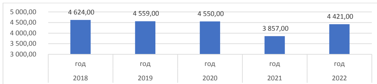
Рисунок 1 Количество СМП за 2018-2022гг., ед.

Динамика состояния малого бизнеса за анализируемый период представлена на рисунках 1 и 2.