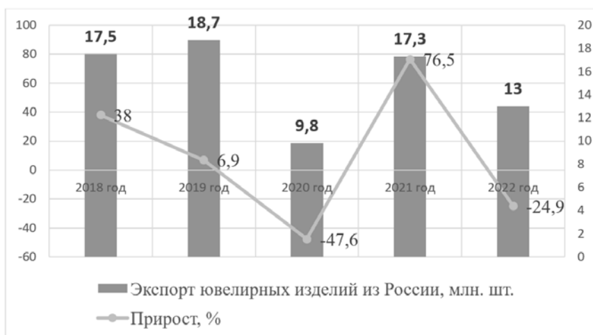
Рисунок 1 – Изменение в объёмах экспорта золота российским ювелирным рынком (составлен автором по [1, с.2; 3])

Российские золотодобытчики в 2022 г. также как и продавцы готовой ювелирной продукции, столкнулись с проблемой потери основных рынков сбыта по отлаженным каналам сбыта.