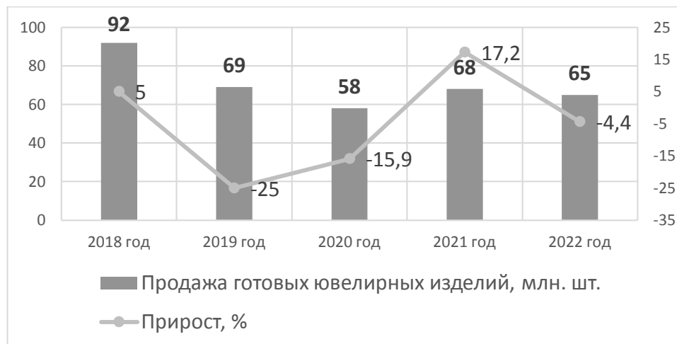
Рисунок 3 – Изменение в объемах сбыта готовой ювелирной продукции на российском ювелирном рынке (составлен автором по [4])

продукции в качестве подушки финансовой безопасности частью населения, спад можно оценить как незначительный [4].