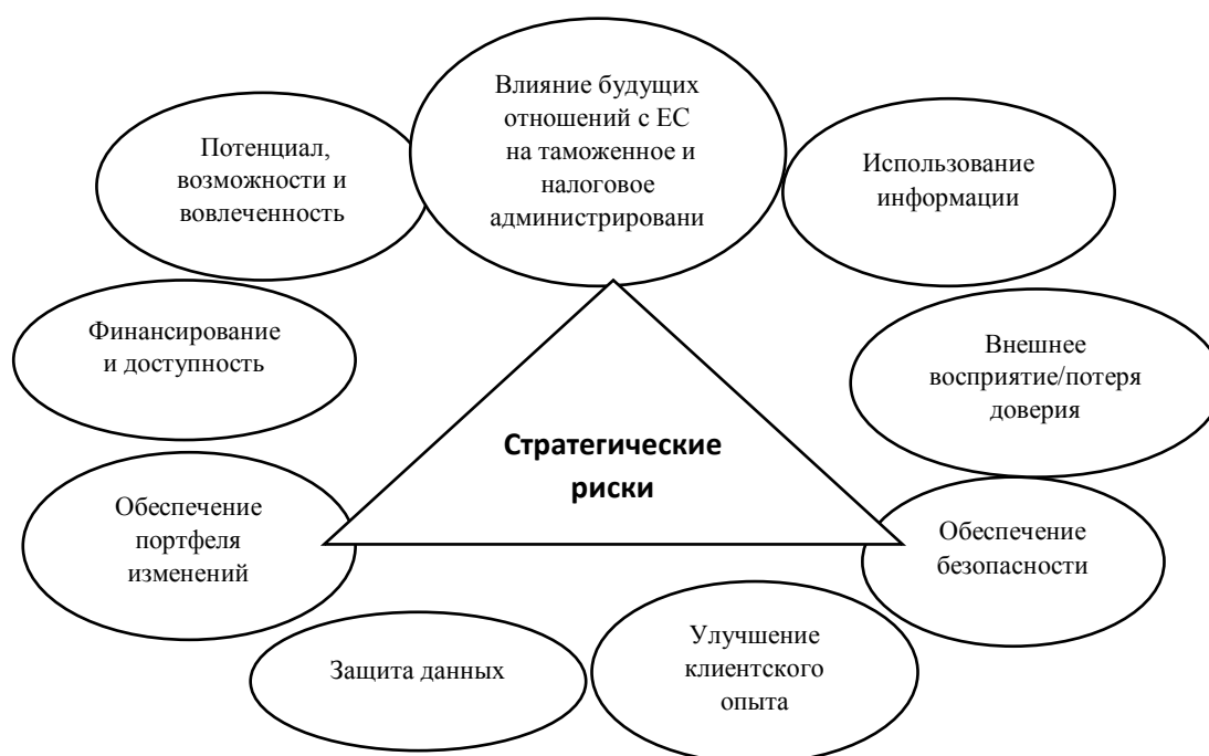
Рис. 2. Стратегические риски СДТСВ (составлено автором)

Для достижения стратегических целей таможенной деятельности, внутренней безопасности, оптимизации работы и уверенности в достижении своих целей таможенная служба Великобритании идентифицирует и управляет 9 стратегическими рисками на рис.2.