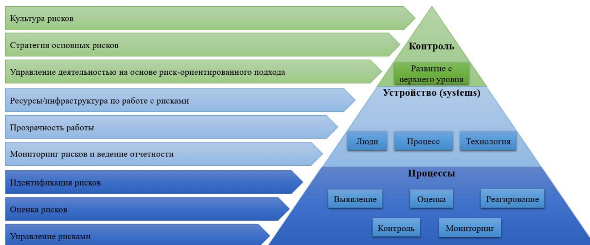
Рис.4. Теоретическая модель интеллектуального риск-ориентированного подхода (составлено автором)

стратегических ориентиров, с учетом ограниченных ресурсов и необходимости рационального их распределения, и также процессный подход к управлению деятельностью на основе управления рисками (рис.4).