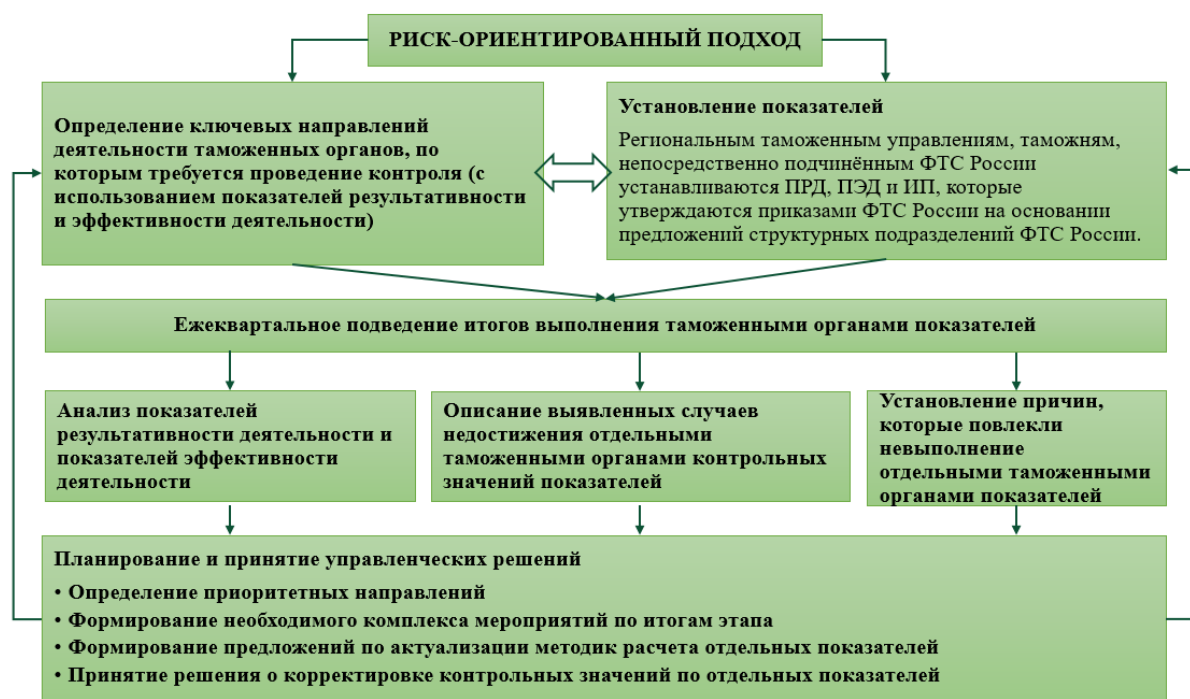
Рис.1. Организация риск-ориентированного подхода в управлении деятельностью таможенных органов (составлено автором)

Организацию управления деятельностью таможенных органов с учетом риск-ориентированного подхода можно представить на рис.1.