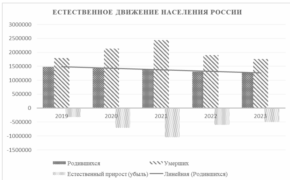
Рис.3. Естественное движение населения РФ, человек.