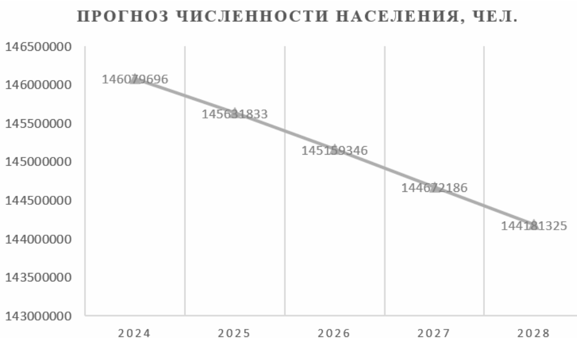
Рис.1. Прогноз численности населения РФ до 2028 г, человек.

Демографическая ситуация в Российской Федерации складывается не лучшим образом, что, в целом, коррелируется с общемировыми тенденциями. Так, численность населения активно сокращается и, по прогнозам Федеральной службы государственной статистики, с 2024 г. по 2028 г. уменьшится на 1.3% (на 1 898 371 чел.), сохраняя средние темпы снижения показателя в 0.3% (примерно на 474 000 чел.) ежегодно (рис.1).