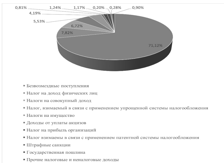
Рисунок 3. - Структура доходной части бюджета за 2023 год

Рассмотрим структуру доходной части бюджета муниципального образования «город-курорт Сочи» на основе доходной части бюджета за 2023 год, которая представлена на рисунке 3.