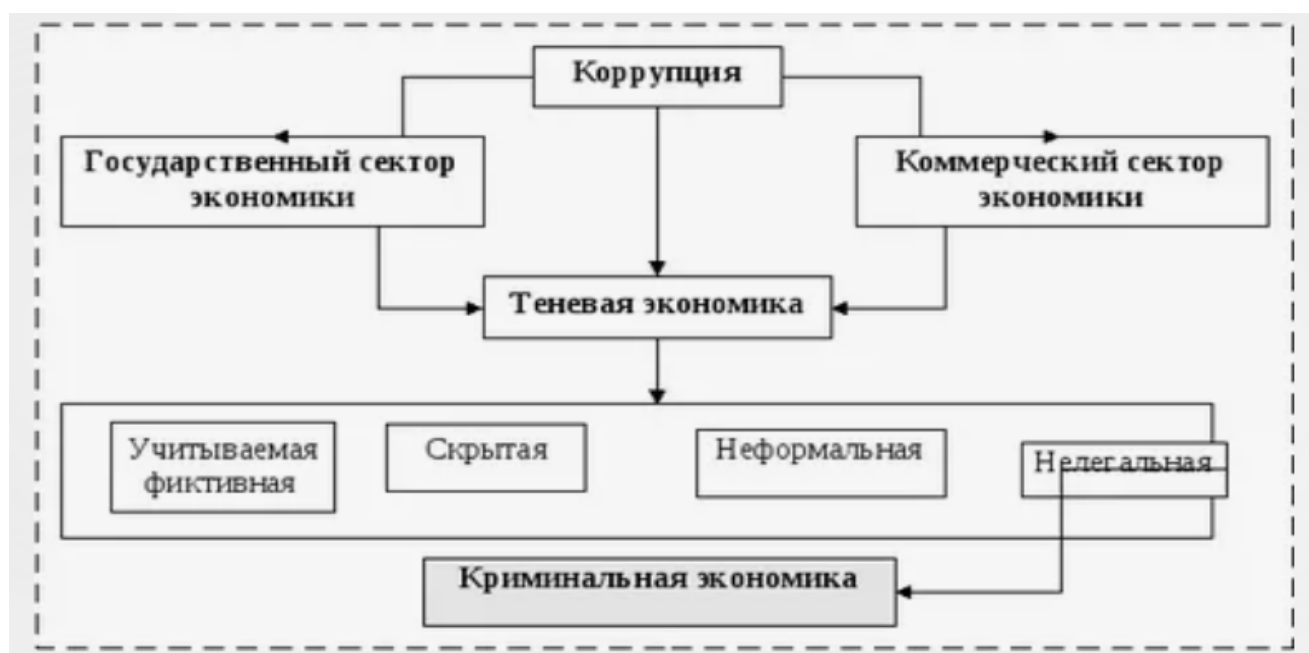
Рис. 1 – Процесс воздействия КН и ТЭ на ЭБ государства [14].

Наглядно данный процесс представлен на рисунке 1 (рис. 1).