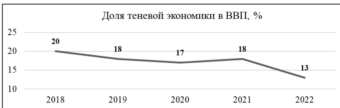
Рис. 2 – Доля теневой экономики в ВВП России на период 2018-2022 гг.

Выше названные индикаторы экономической безопасности не отражают достаточной полноты риска теневой составляющей, которая отрицательно воздействует на экономическую безопасность страны. Доля теневой экономики по отношению к официальной сфере, производству и частному предпринимательству в развитых странах является минимальной (рис. 2) [3].