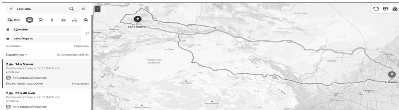
Рисунок 3 – Путь грузового транспорта из Цзинань в Хоргос. [10]

Завод грузовой техники Sinotruk находится в городе Цзинань, провинции Шаньдун. На рисунках 3 и 4 показаны маршруты из Цзинаня в Хоргос (4000 километров) и из Цзинаня в Забайкальск (2620 километров).