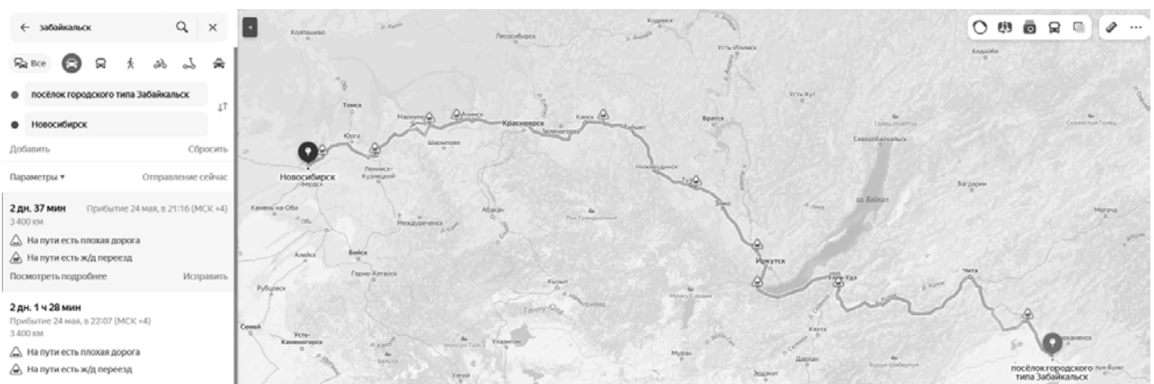
Рисунок 1 – Путь грузового транспорта из Забайкальска в Новосибирск.

Международные перевозки грузового транспорта из Китая в Россию являются одним из факторов успешной реализации техники на российском рынке. Ключевая проблема заключается в том, что технические средства должны преодолеть на своем ходу расстояние от 6000 до 12000 километров. Это обусловлено тем, что транспортировка техники осуществляется по двум основным направлениям: через Казахстан (пункты Хоргос и Бахты) и через Дальний Восток (пункт Забайкальск). Основные маршруты перегона грузовых средств показаны на рисунках 1 и 2.