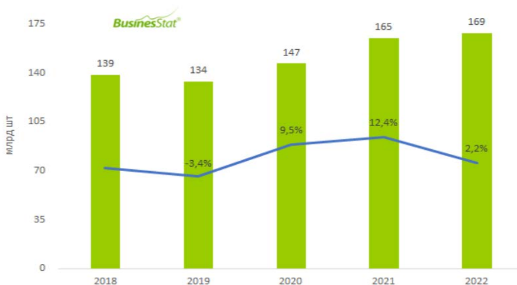
Рисунок 1– Продажа тары и упаковки в России [2]

В 2022 г рост продаж тары и упаковки в России продолжился, но составил всего 2,2% [1].