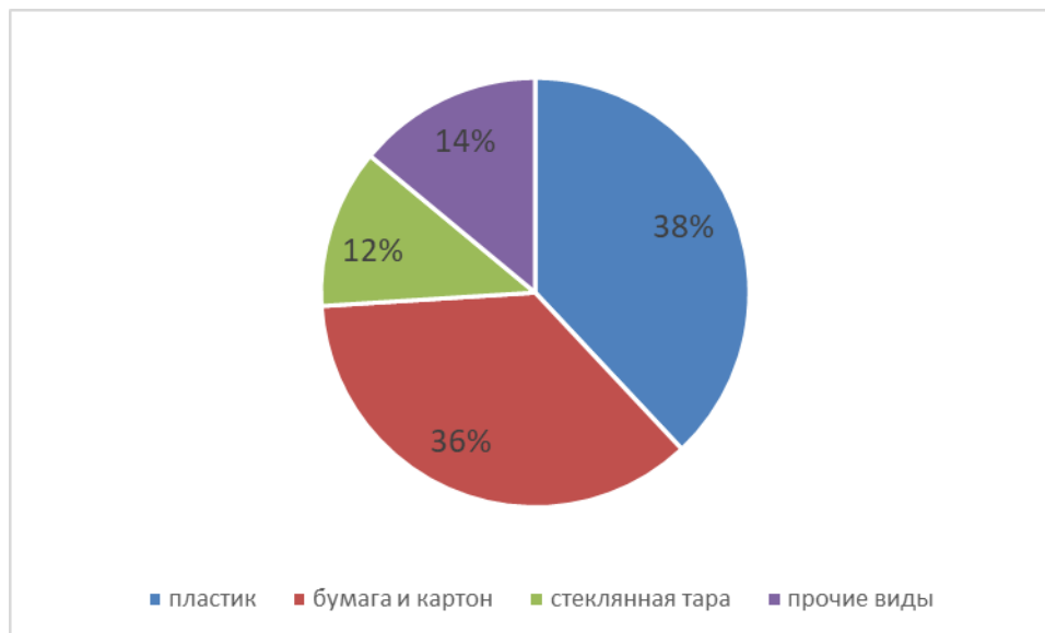
Рисунок 3 – Рынок упаковки (составлено автором)

По оценкам различных экспертов, рынок упаковочных изделий России в 2021 г. составил порядка 1,2 трлн рублей. В 2022 г. целлюлозно-бумажная промышленность пострадала от западных санкций, введенных после начала СВО. С этого момента были зафиксированы перебои в поставках сырья, а иностранные компании, владеющие крупными российскими предприятиями, объявили об уходе из России. Выросли цены на офисную бумагу. Производители продуктов питания прибегли к вынужденной смене упаковки. Рост цен ощутили все: пищевое производство, общепит и, разумеется, конечные потребители [13].