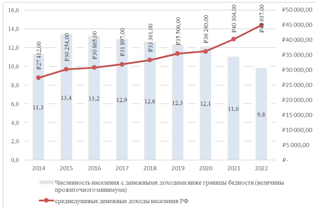
Рис. 2 – Численность населения с денежными доходами ниже границы бедности (величины прожиточного минимума) в РФ [составлено авторами]

Следует учесть, что методология национального счетоводства использует общепринятый элемент метода бухгалтерского учета - балансовое обобщение, который предполагает, что Национальный счет строится в табличной форме, которая включает две совокупности показателей – ресурсы и их использование. Равновесие между объемом ресурсов и их использованием достигается с помощью балансирующей статьи, которая рассчитывается в предыдущем счете и отображается в разделе «использование», и является исходным показателем раздела «ресурсы» следующего счета. Под экономическими измерениями учетного процесса СНР следует понимать набор экономических признаков, которые предоставляют