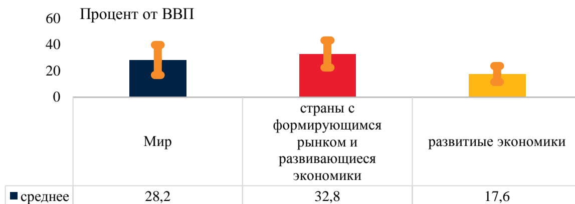
Рис.2. – Доля неформального сектора экономики в ВВП (2020). [4, с.12]

В более широком смысле неформальность ассоциируется с низким уровнем развития. Если в странах с развитой экономикой на неформальную экономику приходится пятая часть ВВП и 16% занятости, то в странах с развивающейся экономикой на нее приходится в среднем треть ВВП и 70% занятости (из них более половины приходится на самозанятость; см. рис.2).