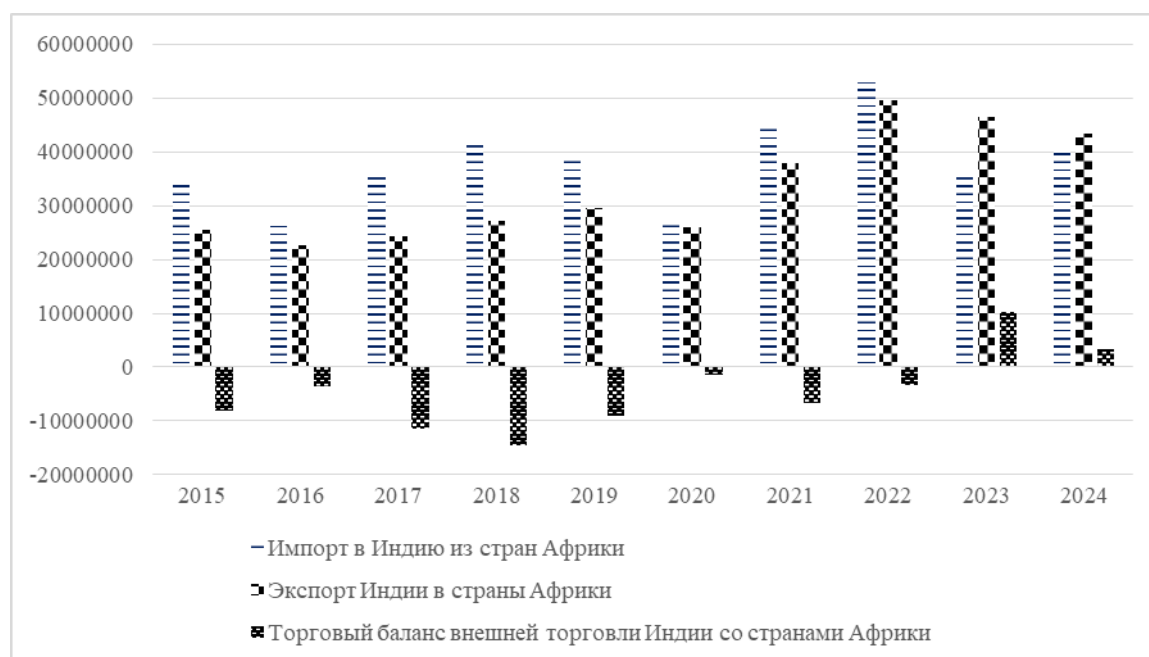
Рисунок 1 – Экспорт, импорт и сальдо товарной торговли Республики Индия со странами Африки с 2015 по 2024 гг., тыс. долларов США