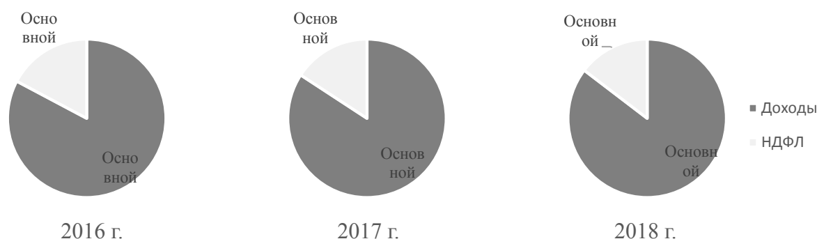
Рис. 1 – Доля НДС в консолидированном бюджете Российской Федерации, %

На основе полученных показателей таблицы 1 можно сделать вывод, что за период 2016-2018 гг. доходная часть консолидированного бюджета Российской Федерации увеличилась на 6 845,6 млрд руб., поступления НДС увеличились на 635,7 млрд руб. Однако согласно рисунку 1 наглядно видно, что их доля в бюджете за анализируемый период снизилась на 3,7%. Данный факт связан с увеличением доли таких налоговых поступлений, как налог на добычу полезных ископаемых и налог на прибыль организаций.