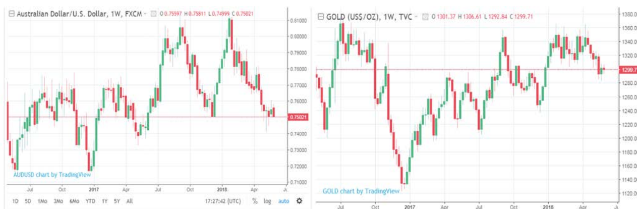
Рис. 2. Курс AUD/USD и стоимость золота за последний год.