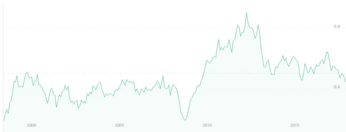
Рис. 5. Курс AUD/EUR

До 2008 года пара AUD/EUR практически не демонстрировала заметных изменений. Мощный рывок курса после 2008 года обусловлен возникновением проблем в европейской экономике на фоне неизменной австралийской стабильности.