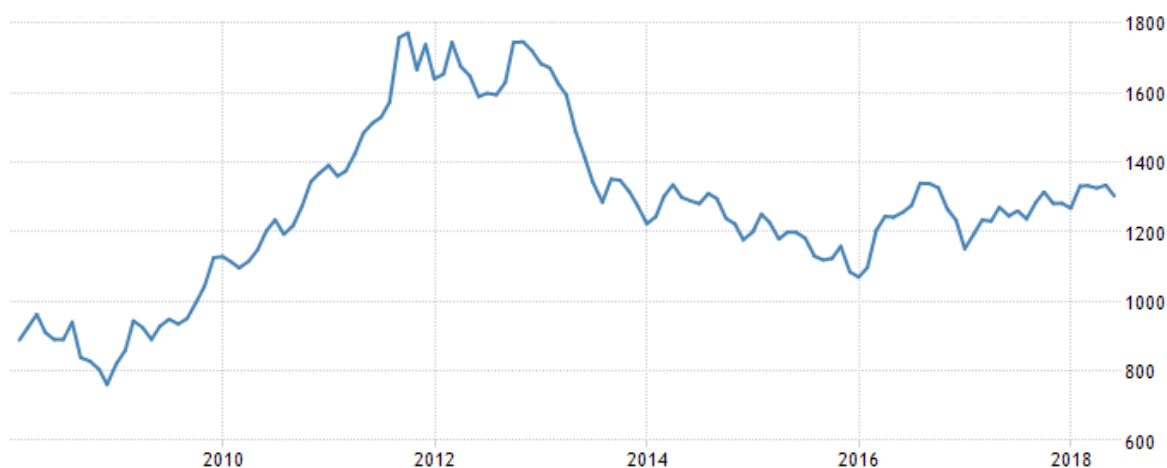
Рис. 1. Стоимость золота