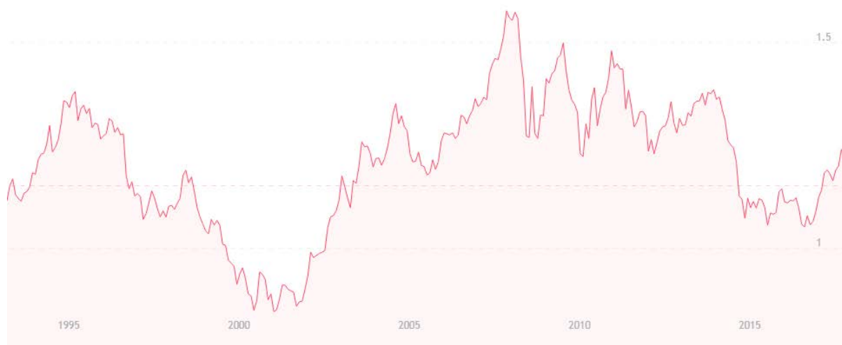
Рис. 4. Курс USD/EUR

Также необходимо отметить, что пара AUD/USD имеет высокую положительную корреляцию с парой EUR/USD, что хорошо видно на графике курса USD/EUR, который периодически очень сильно похож на графике курса AUD/USD (рисунок 4).