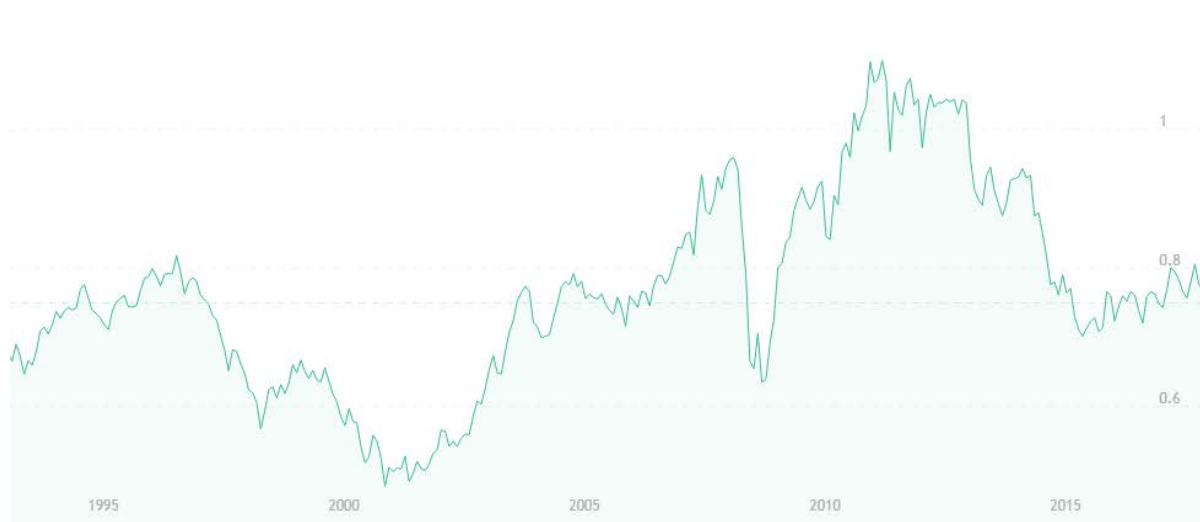
Рис. 3. Курс AUD/USD

Также необходимо отметить, что пара AUD/USD имеет высокую положительную корреляцию с парой EUR/USD, что хорошо видно на графике курса USD/EUR, который периодически очень сильно похож на графике курса AUD/USD (рисунок 4).