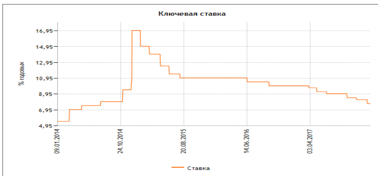
Рис. 2 – Динамика ключевой ставки Банка России, % годовых [10]

Росту кредитных вложений отечественных банков в реальный сектор экономики способствовал такой фактор, как снижение Банком России учетной процентной ставки. В исследуемый период имела место неравномерная динамика ключевого показателя банковского кредитного рынка (рис. 2).