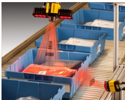
Рис. 2- Камеры машинного зрения

Так, в 2020 году ПАО «Группа Черкизово» смогла опередить своих конкурентов, запустив проект по использованию машинного зрения при контроле качества продукции на производственной линии. Аппарат сканирует производственную линию, делая паузу на различных контрольно-пропускных пунктах, чтобы обнаружить любые возможные дефекты (цвет, форма, размер и так далее) и принять надлежащие меры по ликвидации последствий, подавая сигнал машине, которая выбрасывает с производственной линии товар с дефектом. Аппарат машинного зрения состоит из систем мультикамер (в количестве пяти) и программного обеспечения для обработки изображения. Изображения взяты в восьми положениях каждой из пяти камер, размещенных в различных углах. Данные изображения были сравнены с заключительным изображением объекта, идеалом товара.