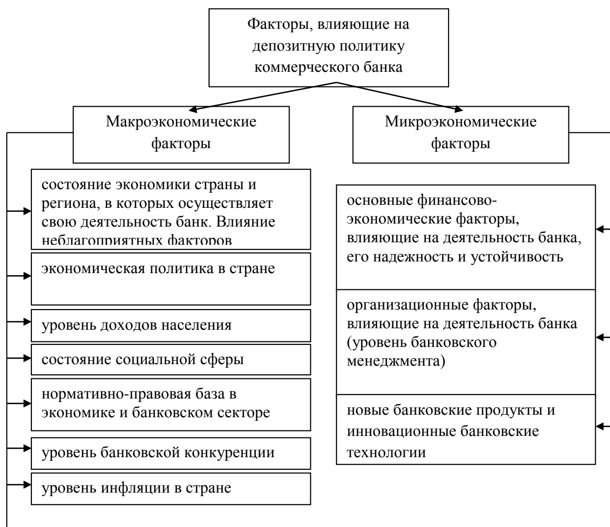
Рисунок 3 – Макроэкономические и микроэкономические факторы, влияющие на депозитную политику коммерческого банка (уточнено автором)

определенной стратегии поведения банка на рынке депозитных ресурсов; уровень менеджмента банка; организационная структура банка и степень его универсальности; квалификация и опыт персонала банка; уровень мониторинга и анализа данного сегмента рынка банковских услуг; коммуникационная и рекламная политика их продвижения на рынок; клиентская база банка; затраты банка на реализацию депозитной политики и др.