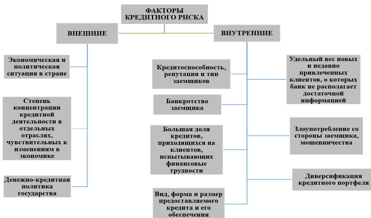
Рис. 1 – Факторы, влияющие на уровень кредитного риска [5].

Степень кредитного риска непосредственно зависит от различных факторов как внешних, так и внутренних (рисунок 1).