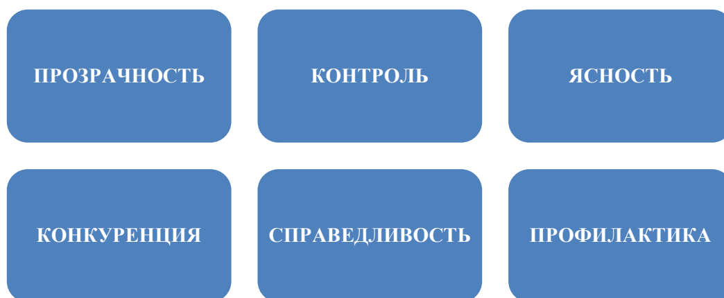
Рисунок 1 - Правила борьбы с коррупцией по А.И. Кирпичникову [составлено автором на основании теоретического материала А.И. Кирпичникова]

В основу разработанных нами правил борьбы с коррупцией легла структурированная схема, предложенная А.И. Кирпичниковым [5; 51] и состоящая из 6 правил (рис. 1).