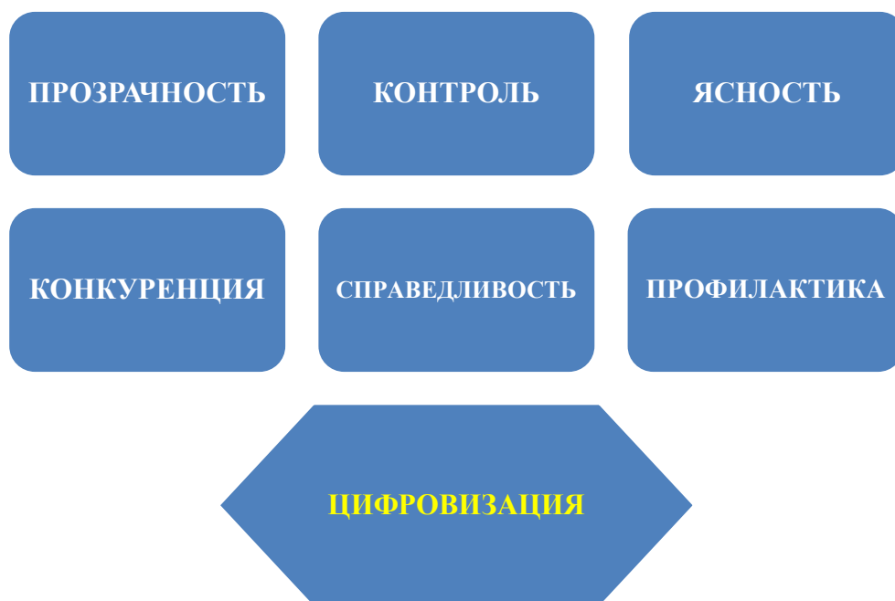
Рисунок 2 - Семь правил борьбы с коррупцией [составлено автором]

Кроме того, необходимо обратиться и к зарубежному опыту, например, Республики Корея, граждане которой могут в режиме онлайн наблюдать за принятием и рассмотрением их заявок, подготовкой и выдачей документов, лицензий, патентов. Мгновенная регистрация документов и полный отчет о ходе выполнения работ уже доступен и жителям Индии и Филиппин [7; 42].