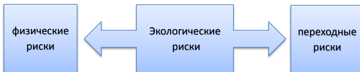
Рисунок 2 – Группировка экологических рисков (составлено авторами)

Все ESG-риски, с которыми сталкиваются банки, можно разделить на 3 группы: риски в области климата и окружающей среды (экологические риски), риски в социальной и управленческой сферах (социальные риски) и репутационные риски. При этом первые подразделяются на физические риски и риски переходного периода (рис. 2).