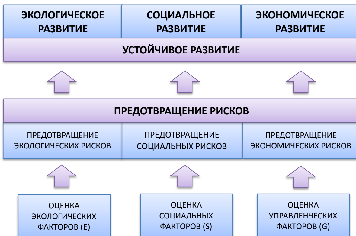
Рисунок 4 – Влияние своевременной оценки ESG-факторов на устойчивое развитие (составлено авторами)

Значимость своевременной оценки ESG-факторов для предотвращения ESG-рисков с целью достижения устойчивого развития проиллюстрирована на рисунке 4.