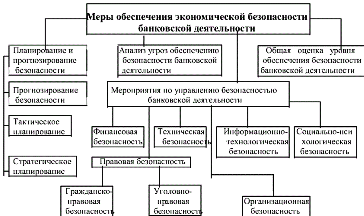
Рис.2. Меры обеспечения экономической безопасности коммерческого банка [3]

Представленные меры дают возможность учесть различные факторы и угрозы обеспечения экономической безопасности коммерческого банка. Основу данных мер составляет планирование и прогнозирование, которые отражены в стратегии развития банка и включают качественные и количественные показатели развития банковских ресурсов [3]. Под угрозой экономической безопасности банка понимают комплекс соглашений, процессов, обстоятельств, которые создают трудности при получении экономической выгоды в интересах субъектов хозяйственной деятельности либо вызывают для них опасность.