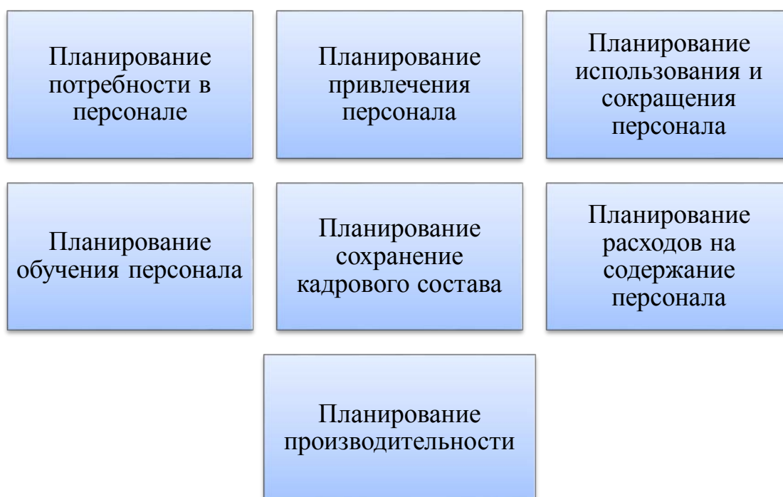
Рисунок 2 – Виды кадрового планирования[3]

Итак, кадровое планирование подразделяется на следующие виды (Рисунок 2):